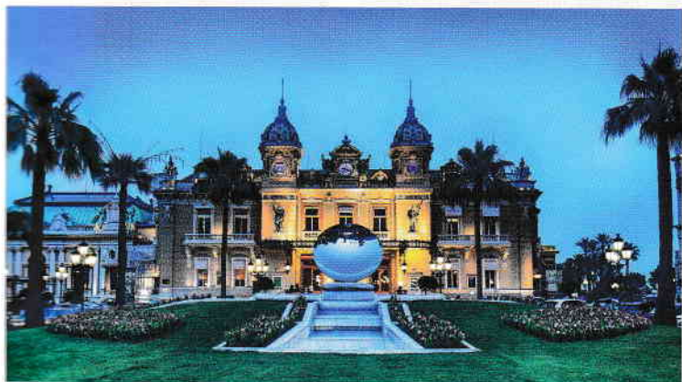
Sus: vedere asupra Le Suquet, Cannes

Este supraconstruit și foarte populat, dar exercită o atracție irezistibilă, fiind asociat cu rafinamentul, luxul și hedonismul. Fiecare dintre principalele sale districte are cel puțin un obiectiv turistic demn de inclus într-un top 10 al Coastei de Azur: Monaco Ville – Muzeul de Oceanografie, Monte Carlo – Cazinoul, iar La Condamine – Jardin Exotique.